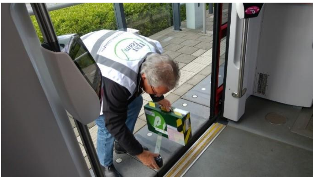
De gebruikte perron / voertuig spleetmeter

Voor de bereikbaarheid/ toegankelijkheid van de haltes en het functioneren van het vervoermiddel is gewerkt met deels zelf ontwikkelde meetinstrumenten en een checklist (bijlage 2), omdat het bij deze elementen gaat om technische harde randvoorwaarden die objectief gemeten kunnen worden. Hierbij is uitgegaan van de normen uit het Handboek Voor Toegankelijkheid, 7 e herziene druk. Bij de geleidelijnen zijn de Ontwerprichtlijnen Routegeleiding 2021 van het Projectbureau Toegankelijkheid als uitgangspunt gebruikt.