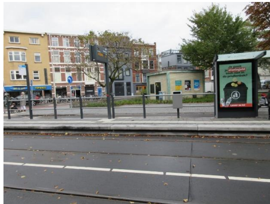
Halte Elandstraat kunnen nog nietjes bij