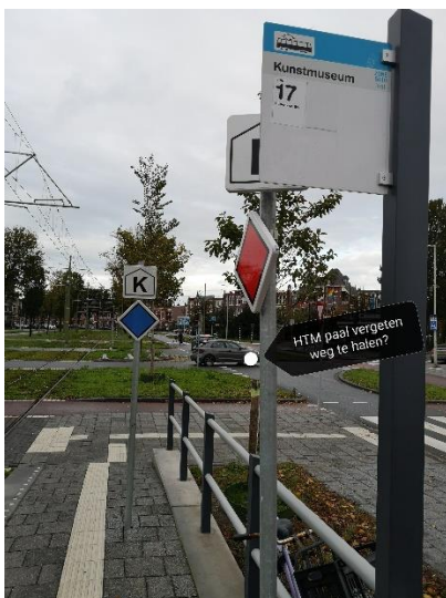
Een paal teveel (?)

Bij de halte Obrechtstraat ligt een 'verloren' stuk tegelwerk dat tot illegaal oversteken uitnodigt.