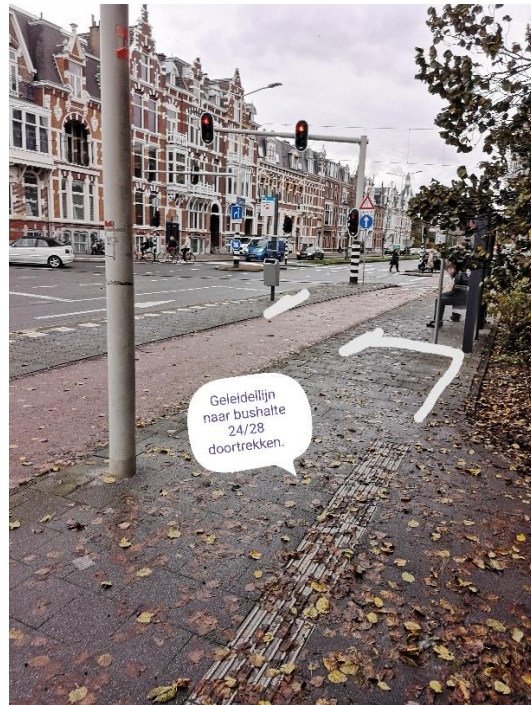
Geen geleidelijn naar buslijn 24/28

Er is geen geleidelijn met attentietegel aangelegd bij de Dris op halte Obrechtstraat.