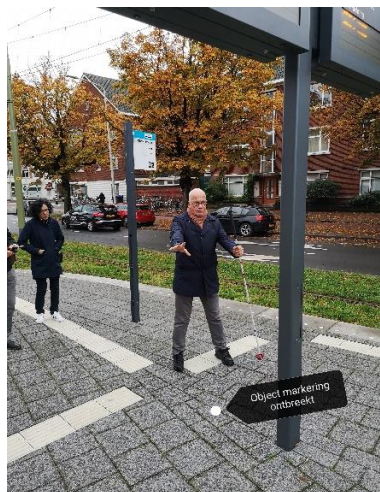
Geleidelijn met attentietegel ontbreekt

Er is geen geleidelijn met attentietegel aangelegd bij de Dris op halte Obrechtstraat.