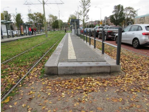
Geen stoptegels aan het eind v.d. lijn