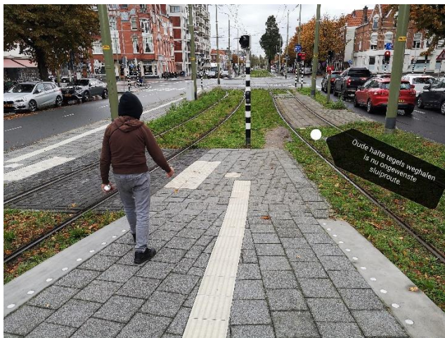
Overtollige stuk tegelwerk