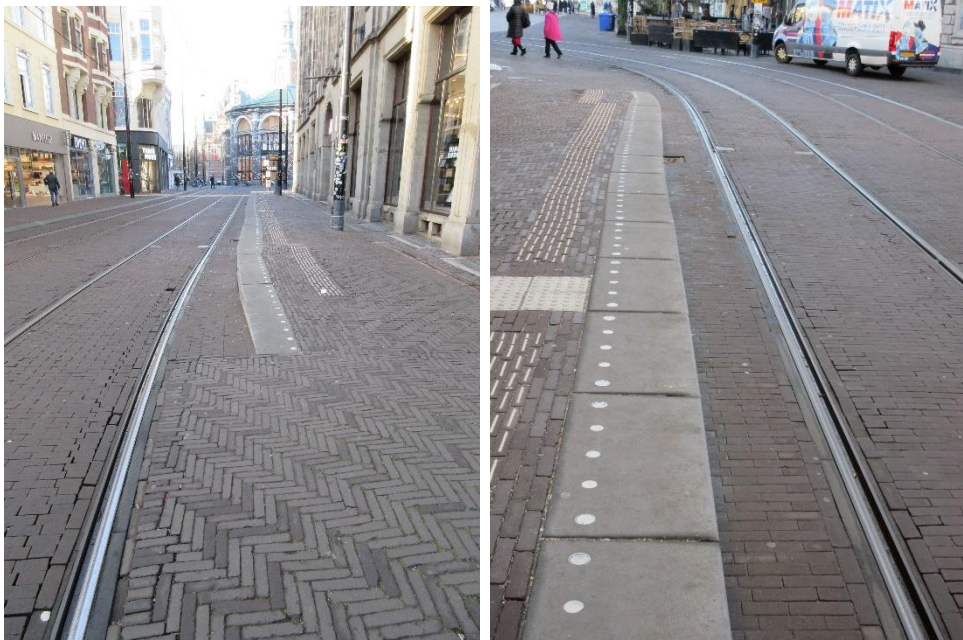
Knik in band aan uiteinde halte

Bijzondere aandacht vraagt de halte Gravenstraat richting Statenkwartier. De halteband langs deze halte heeft een lelijke knik aan het einde van de halte. Dit kan invloed hebben op de spleetbreedte bij de laatste deur afhankelijk waar de tram stopt. Het rechttrekken van de band op die plek kan dat voorkomen.